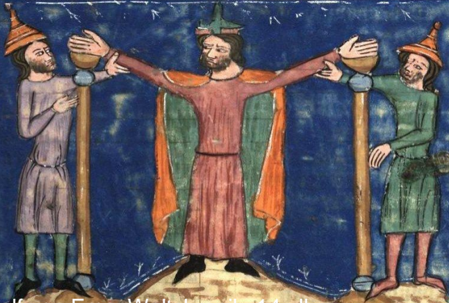
Rudolf von Ems, Weltchronik; 14. Jh.